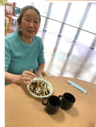
皆さま『出来立てで美味しいよ〜』と、大好評でした