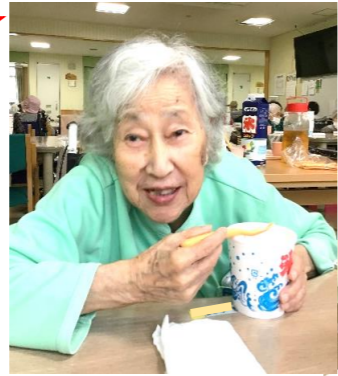
手動、自動、それぞれのかき氷機を使用し、皆さまにかき氷を作っていただきました。