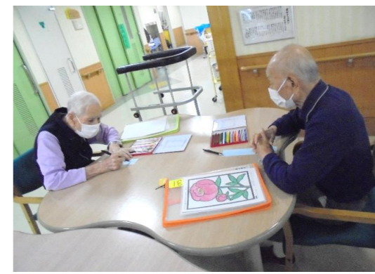
短冊に願いを込めて...飾りも作りました