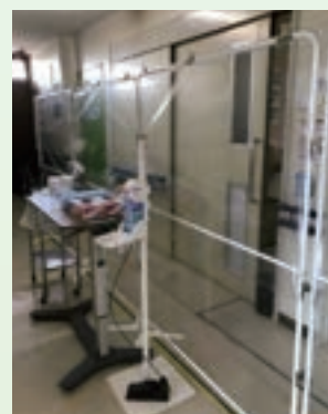
ゾーニングの様子