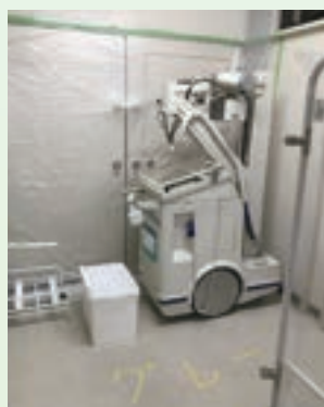
閉められた1階病棟廊下の防火扉

コロナ病床稼働の間、病棟看護師をコロナ病棟に配置しております。一般病棟の看護師数が減ることに合わせて入院病床数を減らして対応し、内視鏡検査や手術件数を制限して対応に当たっております。皆様にはご不便とご迷惑をおかけしますが、ご理解とご協力をお願い申し上げます。