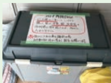
リネン類のコロナ専用BOX